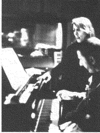
فيروز وزياد في الاستوديو.

يقارب كلُّ آلةٍ موسيقيّةٍ مشاركةٍ على حدة، ويعرّز دورها و«صوتها» في النسيج الموسيقيّ.