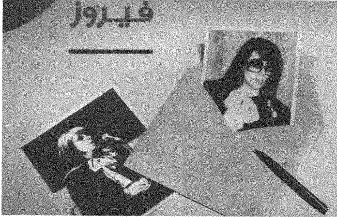
من غلاف أسطوانة معرفتي فيك (١٩٨٧).

امرأة تخاطب حبيبها بخصوص علاقتهما. ٢) الحكاية والسرد، حيث راوٍ وشخصيات تربطها علاقات زمنية تسلسلية ومنطقية (سبب ونتيجة). المرأة الراوية في «معرفتي فيك» تخاطب حبيبها التي تعرفت إليه بعد مللٍ وزعل، وتشير بشكل غير مباشر إلى حبيب سابق (يُحتمل أن يكون هو مصدر «الزعل»). أما التسلسل السردية، فيقوم بين ثلاثة أحداث أساسية: «الزعل والملل» (الفقرة الثانية)، ثم معرفتها بحبيبها وتطور العلاقة بينهما ووصولها إلى «حلقة» مفرغة (الفقرة الثالثة)، يليها تحليلها لوضع هذه العلاقة «اليوم»