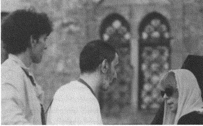
فيروز وزياد وريما الرحباني في بيت الدين، ٢٠٠٠.

بيد أن من أبرز ما يسم التجربة الفيروزيّة - الزيادة ما أضفاه زياد على الأغنية الفيروزيّة المسجّلة في الأستوديو، أو المؤدّة على الخشبة، من مسرحيّة تتّسع تارةً، وتنحسر طورًا. هكذا، نجده ينتقل بالسامع، على