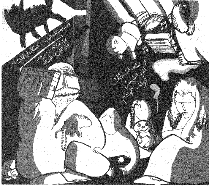
الحن الملاحي: رسم لراند شرف.

عليها عبر الأسطوانات المدمجة لأنّ زيادًا كان يرفض تصويرَ مسرحياته). وأحد أصدقائي في مونتريال يستمع إلى تسجيل هذه المسرحية في سيارته الكرة تلو الكرة، من دون أن ينتقص هذا من المتعة التي تقدّمها له. على ذكر المدينة والقرية والمناطق، يجدر الانتباه إلى أنّ زيادًا، على الرغم من تفكيره اليساري وانتقاله في عزّ الحرب الأهلية من السكن في «المناطق الشرقية» من بيروت إلى المنطقة الغربية منها، وعلى الرغم من أنّ جمهوره