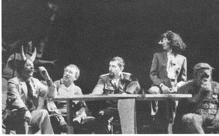
من بخصوص الكرامة والشعب العنيد (١٩٩٣).