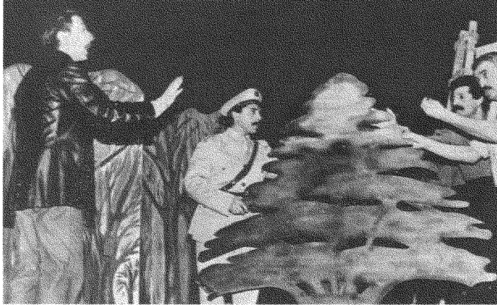
مشهد من شي فاشل.

هذا الاتصال بالحاضر لهو من الأمور المهمة التي تميّز مشروع زياد من مشروع أهله. فإذا كان المسرح على يد زياد قد تحول إلى رواية، فإنّ عمل الأخوين رحباني بعكس ذلك: فلقد حول المسرح إلى ملحمة. وما يسمّى الملحمة، بحسب باختين وغيره أمثال لوكاش، (٤) هو ابتعادها وانكتمها عن أيّ حاضر. وفي حين تُنظر الملحمة إلى الوراثة، فإنّ الرواية والأجناس المحوّلَة إلى رواية متجدّرة في الحاضر، بل تُنظر دائماً