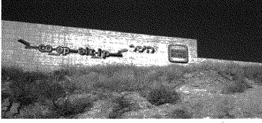
فرع بيرغر كنج في معالي أدوميم