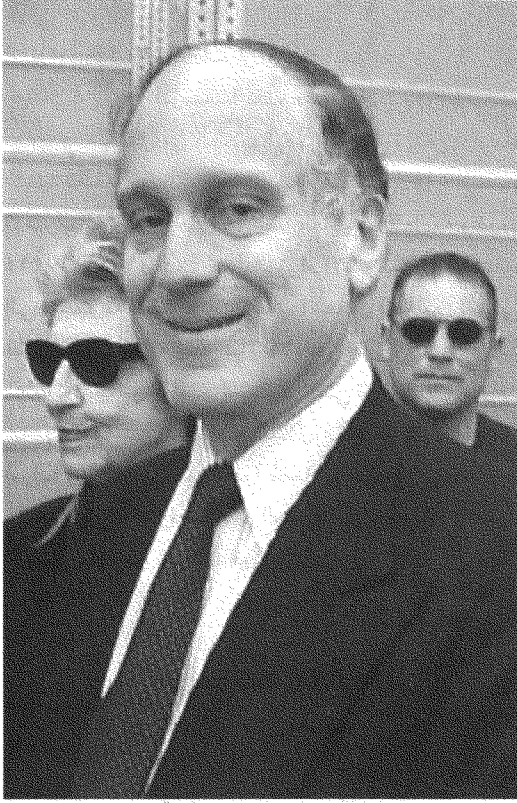
إستيه لودر «تطهير» القرى العربية عن وجه إسرائيل (الصورة لرئيسها رون لودر)

الجدير ذكره أنّ رون لودر هو أيضاً رئيس «الصندوق القومي اليهودي» (Jewish National Fund) الذي يجمع الأموال لنهّب الأراضي الفلسطينية وفرض المزاعم الصهيونية بأحقّيتها فيها (٢٧) لتحليل مفصلٍ للعمليات العنصرية التي يقوم بها الصندوق المذكور ولتمويله لـ «ديموقراطية» تُؤثر أتباع دينٍ محدّدٍ على الأديان الأخرى، راجع www.palestineremembered.com/Articles/JNF/Story1513.html .