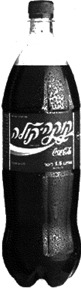
كوكاكولا مذاق العصرية الإسرائيلية

التنويه إلى أن هذه الشركة افتتحت مصنعًا في إسرائيل عام ١٩٦٨ ردًا على المقاطعة العربية، رغم أن ذلك الافتتاح سبّب «أضرارًا مادية خطيرة لكوكاكولا» قُدّرت بـ «ملايين الدولارات» (١١)