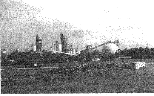
مصنع إنتل في مستوطنة كريات غات. أثار المنازل الفلسطينية لا تزال قائمة

وقد قال نيكى پاپو (N. Pappo)، المسؤول التنفيذي الرئيسي لشركة «پاسكول»، إن هذه الشركة الإسرائيلية تخطط لاستخدام الأموال لزيادة الأبحاث والتنمية ولتساعد في إنشاء أعمال لها داخل الولايات المتحدة. (٦٤)