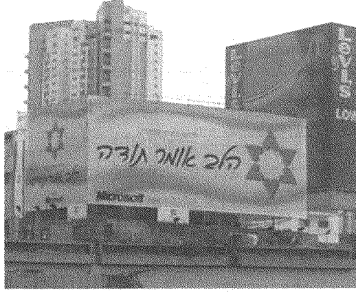
مايكروسوفت «من أعماق قلوبنا، شكرًا لجيش الدفاع الإسرائيلي» (يافضة في تل أبيب، نيسان ٢٠٠٢)

(Microsoft) إن مركز مايكروسوفت للتنمية والأبحاث