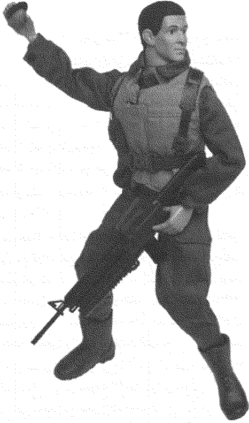
هاسبرو لعبة تمثِّل الجندي الإسرائيلي في حربه ضدَّ «الإرهاب» العربي