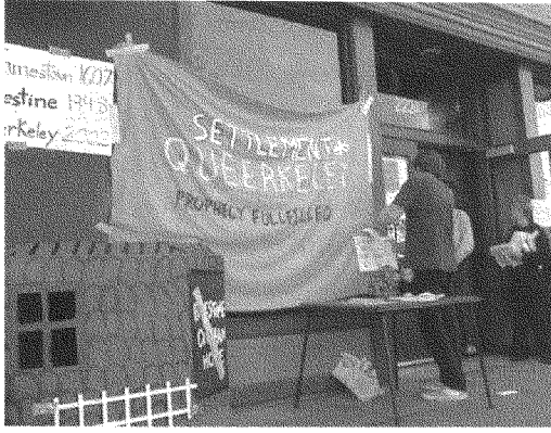
ستاربكس ملتزمة بإسرائيل «١١٠» (الصورة نشاط معادٍ للشركة في كاليفورنيا)