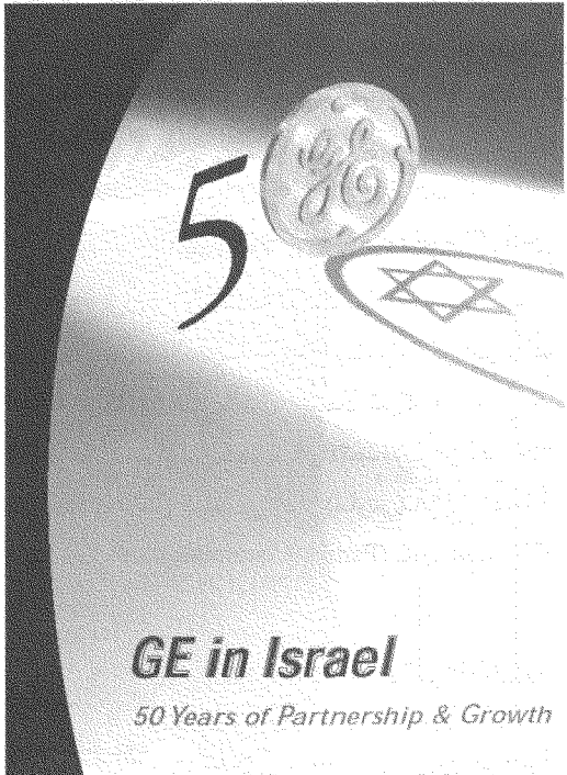
جنرال إلكتريك في إسرائيل ٥٠ عاماً من الشراكة والنمو

وفي سنة ١٩٩٨ تلقى السيد رونالد لودر، بصفته ممثلاً لشركة RSL Communications المحدودة، جائزة اليوبيل الذهبي من بنيامين ناتانياهو (راجع الفقرة الخاصة بـ «دانون» أعلاه). (٣٢)