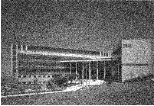
أي بي أم: مركزها الضخم في حيفا

في منتصف العام ٢٠٠٢ أعلنت هيووليت باكارد عن خطة لبناء مصنع بقيمة ٢٥ مليون دولار لشركة «أنديغو» التابعة لها في كريات غات (الفاوجة وعراق المنشية سابقاً). وهذا المصنع سيشغل في البداية ٧٠ موظفاً، يهودياً حصراً، وسيصنع أصنافاً من الحبر الرقمي. (٥١) ويتوقع أن يدر ٥٠ مليون دولاراً في العام، ٩٩٪ منه ناجم عن مبيع المنتجات في الخارج. (٥٢)