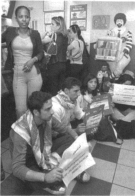
اعتصام في ماكدونالدز - بيروت ضدّ دعمها لإسرائيل (٢٠٠٢)

(McDonald's) تساعد إسرائيل من خلال التبرعات