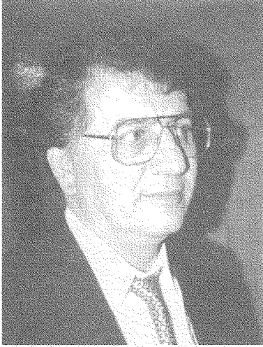
سميح القاسم: تواصل مع أجيال مقاومة