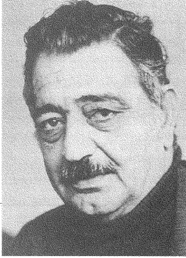
قبل رواية يحيى يخلف بحيرة وراء الريح كانت مسرحية إميل حبيبي أم الروبابيكا قد سارت في الاتجاه نفسه من مراجعة الذات أمام رياح المحاسبة الكبرى