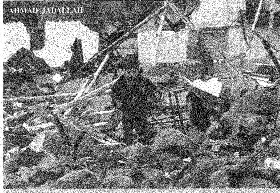
«الكفاح المسلّح... وصفة للبيّوس والكارثة»: تدمير منازل في رفح (٢٠٠٢/١/١١) عقب مقتل ٤ جنود

أما بالنسبة إلى رأيي في الأفعال والبدائل فليس في استطاعتي إلا أن أكرّر ما طرحته منذ سنوات كثيرة وكرّرتُه بإيجاز في الصفحات السابقة.