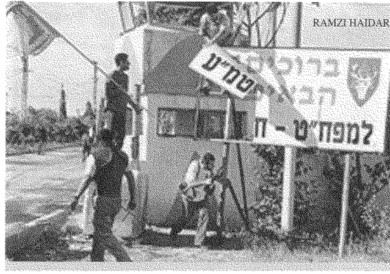
«اعتقد أنّ هذا النموذج لا يلائم الفلسطينيين إلى حدّ كبير»: حزب الله منتصراً في الجنوب

إنّ الرأي العام العالمي عاملٌ ذو دلالةٍ ساحقة. وهذا ينطبق بشكلٍ خاص، ولأسباب واضحة، على الرأي العام الأميركي. وقد يكون فشلاً منظّمة التحرير الفلسطينية الأعظم - وهي فشلت كثيراً - هو أنّها لم تفهم يوماً هذه النقطة البسيطة. أنا أستطيع أن أتحدّث هنا مستنداً إلى تجربة شخصيّة في هذا المجال. وفي رأيي أنّ رفض منظّمة التحرير الفلسطينية أن تفعل ما كان بإمكانها أن تفعله في هذا المجال - وأقول إنّه رفضٌ لا فشلٌ - يُعدّ خطأً فادحاً. وعليّ أن أقول إنّي طوال السنوات السابقة كنتُ على اتصالٍ بعدد كبير من المجموعات العنثاليّة ولكنّي لم أجد مثلاً هذا العجز المطلق عن فهم أهميّة الرأي العام والعمل التضامنيّ