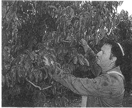
«المزارع... مدني... حتى لو كان يملك بنقوية ويعيش على أرض محتلة»: أحد سكان مستوطنة شايلو (الخليل)

بسبب مصالح اقتصادية جبارة من أجل «مشاريع تنمية» ممولة من المجتمع الدولي الشهير؟ كل هذه الحالات حالاتٌ جدية، وإن محاولة إيجاد إجابات عامة على مستوى الأسئلة التي تطرحونها أمرٌ لا أمل فيه على الإطلاق. وما نحن نعود إلى الوضع المألوف في التعامل مع أمور البشر إذ، ببساطة، ليست هناك معادلات عامة، باستثناء بعض المبادئ التي هي بدورها غامضة وضبابية قليلاً أو كثيراً. إن الإجابات الحقيقية ذات الأهمية الإنسانية تعتمد اعتماداً