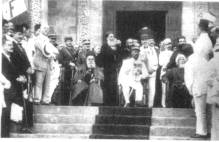
لبنان الكبير يُعلن برعاية الطوائف

تأسيس الطائفة فَتَحَ صراعًا ثانيًا بين الأعيان والعامّة، لأنّ الحقبة الطائفية الجديدة باتت جسرًا لدخول العامّة العمل السياسي بحجّة الدفاع عن أبناء الطائفة وعن بنود المشروع الإصلاحي العثماني. فمثلًا، عندما انتفضت العامّة المارونية على العائلات الإقطاعية في عامي ١٨٥٩ و ١٨٦٠ ادّعت أنّ الإصلاح العثماني لم ينصّ على المساواة الدينية وحدها بل على المساواة الاجتماعية أيضًا. فثورة طانيوس شاهين الشهيرة رَفُضَتْ، انطلاقًا من تأويلها للإصلاح العثماني، تسلُّط الإقطاع الماروني على أهالي كسروان، وحاولت في عام ١٨٦٠ «نجدة» مسيحيي الشوف من تسلُّط «الدروز». ورغم أنّ هذه المبادرة فشلت، فإنّها أسهمت في تفجير الوضع في أواخر أيار عام ١٨٦٠. لقد كانت هذه الحرب، إذن، كنايةً عن صراعٍ طائفيٍّ واجتماعيٍّ في آن واحد. والذي حدث، باختصار، هو محاولة تغيير مفهوم النظام الطائفي من مفهوم هرمي لا يُتيح لناس عاديّين فرصة بناء مستقبلهم، إلى مفهوم شبه ديمقراطي، وإن كان طائفيًا وأحيانًا دمويًا. وهذه المحاولة التي فشلت في أول الأمر هي - ويا للمفارقة - حربُ الستين.