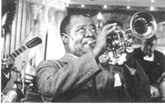
لوي آرمسترونغ: لماذا «يُقترح» عدم بث أشهر أغنية له؟

[رمزي الشعور القومي الأميركي زمن الحرب]. وكانت الصورة الأخيرة من السلسلة المصورة إعلاناً لدمي من الإعلام والشرايط كُتب عليها «بـ $١٩,٩٥ فقط، تُضاف إليها $٤,٩٥ كلفة الشحن!»