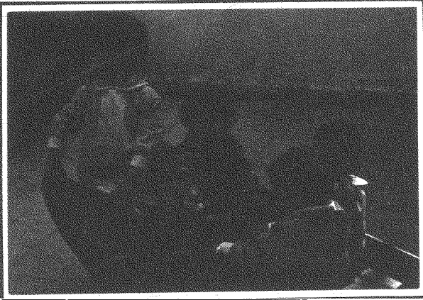
(*) نشيد يغنيه الأطفال في جميعروضات «مؤسسة غسان كنفاني الثقافية».

ليمونة وزهرة وورده جورية وانت يا أرضي نوري وعينيّ. صرت رصاصة صرت شظية من يوم ما عرفنا درب الحرية كانت أمنية، صارت غنية غسان، غسان، غسان علمنا حبّ القضية