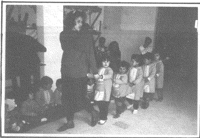
مركز المعلومات والتدريب - مؤسسة غسان كنفاني الثقافية، بيروت

من هذا المنطلق تأسست في بيروت في الذكرى الأولى لاستشهاد غسان «مؤسسة غسان كنفاني الثقافية»، وهي «مؤسسة ثقافية لبنانية» تحاول أن تحقّق بعض الطموح الذي أراده غسان. وقد عُيّنت المؤسسة منذ تأسيسها بفتح رياض للأطفال اللبنانيين والفلسطينيين الذين تتراوح أعمارهم بين الثلاث والست سنوات، واتخذت المؤسسة مراكز لهذه الروضات في المخيمات وجوارها حيث تشتد الحاجة وحيث يتجمّع المحرومون.